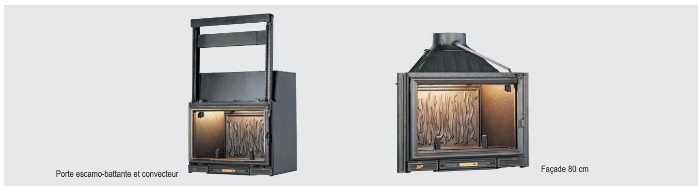
Porte escamo-battante et convecteur

• PORTE ESCAMO-BATTANTE le clapet s'ouvre automatiquement au relevage et à l'ouverture de la porte