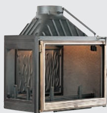
Angle droit ou gauche