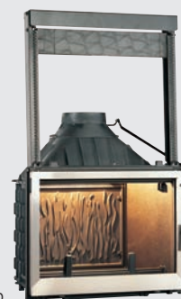
Porte Seguin Déco