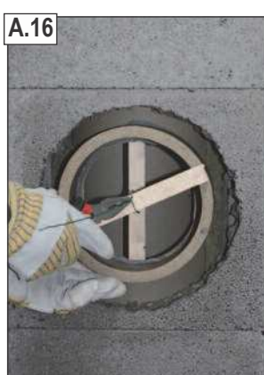
Pritvirtinti dūmtakio dalį prie šamotinio vamzdžio.