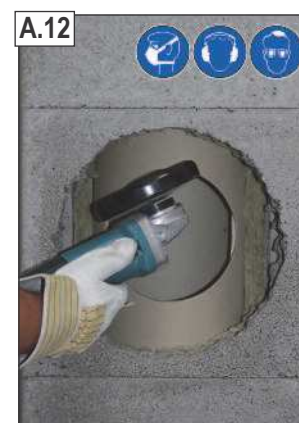
Kampiniu šlifuoekliu nugludinti angos kraštus.