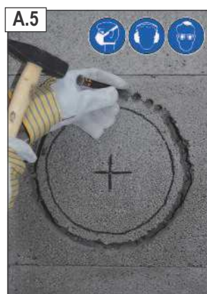
Likusias perimetro dalis blokelyje išskalti mažu kalteliu.