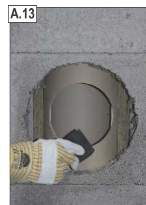
Išpjovos kraštus nuvalyti drėgna kempine.