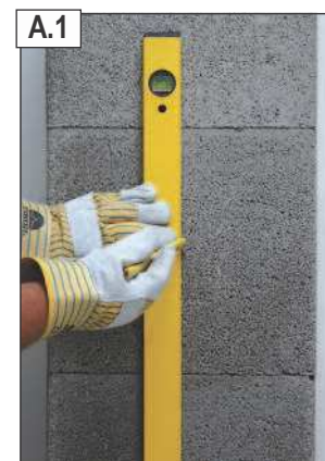
Pažymėti reikiamą dūmtakio atšakos kiaurymės aukštį.