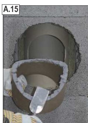
Ant nupjauto vamzdžio galo užtepti „Schiedel“ vamzdžių klijų.