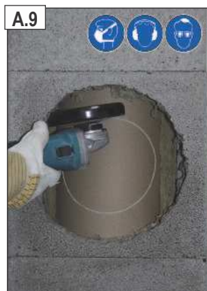
Kampiniu šlifuoekliu įpjauti pažymėtą apskritimą.