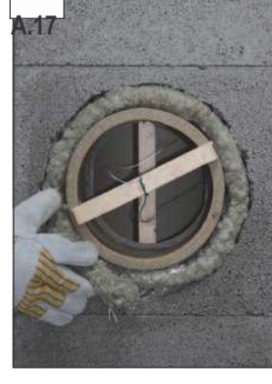
Užsandarinti apkamšant sandarinimo virvę.