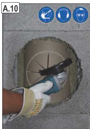
Kampiniu šlifuoekliu padaryti skersines įpjovas šamotiniame vamzdyje.