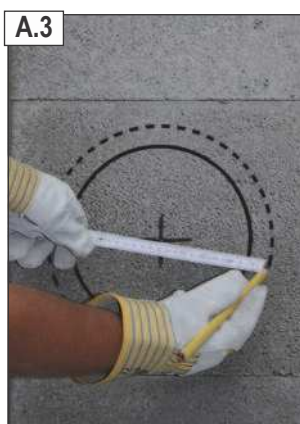
Apie dūmtakio vamzdžio perimetrą apibrėžti 2 cm didesnį apskritimą, kad vėliau būtų galima įsprausti sandarinimo virvę.