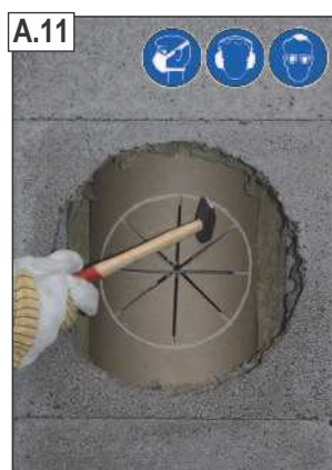
Įpjautas šamotinio vamzdžio dalis atsargiai pašalinti plaktuku.