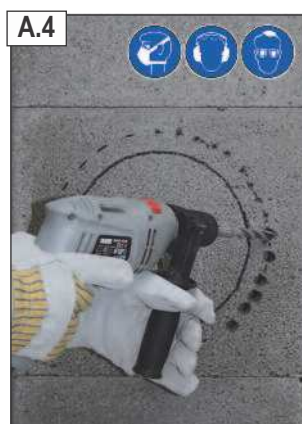
Gręžtuvu ir mažu mūro grąžtu (ø 8 mm) pragręžti apibrėžtą perimetrą. Po to padidinti skylės naudojant didesnį grąžtą (ø 12 mm).