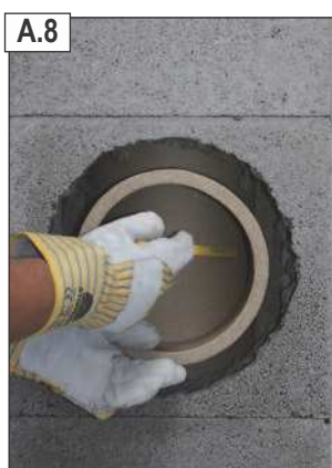
Naudojant dūmtakio vamzdžio dalį kaip šabloną apibrėžti jo vidinį perimetrą.