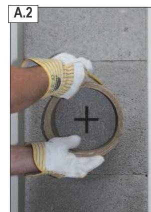
Naudojant dūmtakio vamzdžio dalį kaip šabloną, apibrėžti apie išorinį vamzdžio kraštą.