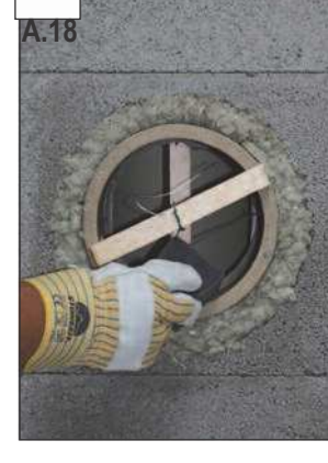
Pašalinti klijų likučius kruopščiai nuvalant. DĖMESIO: Būtinai laikykitės nurodyto „Schiedel“ vamzdžių klijų džiūvimo laiko!