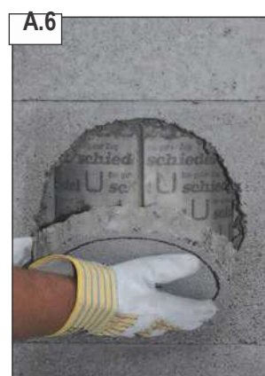
Išimti kamino blokelių dalį ir išvalyti angą.