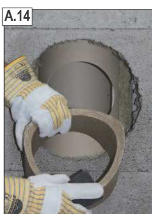
Nuvalyti nupjautą dūmtakio vamzdžio dalį drėgna kempine.