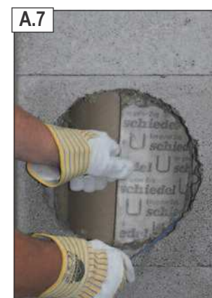
Naudojant pjūklelį palei angos kraštą nupjauti izoliacinę medžiagą ir ją išimti.