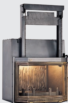
Porte escamo-battante et convecteur

• PORTE BATTANTE ET ESCAMO-BATTANTE le clapet s'ouvre automatiquement au relevage et à l'ouverture de la porte