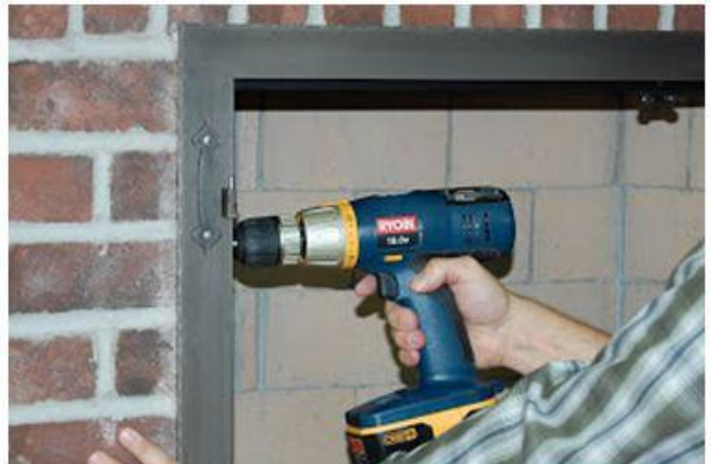
Nerekomenduojame gręžti skylės plytoje arčiau kaip 20mm iki jos krašto