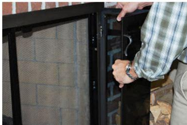
Uždėkite dureles ant pritvirtino rėmelio