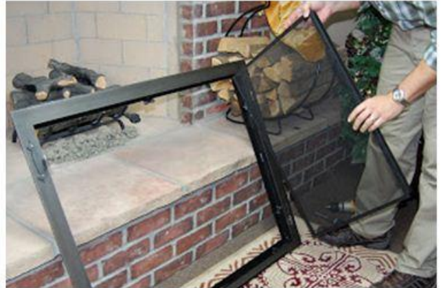
Prieš montavimą nuimkite dureles nuo rėmo

Pridėkite durelių rėmą prie židinio angos ir pažymėkite aukštį, kur bus židinio durelių tvirtinimai. Tame pačiame aukštyje žymekliu pažymėkite tašelį plytoje, kur bus tvirtinimas.